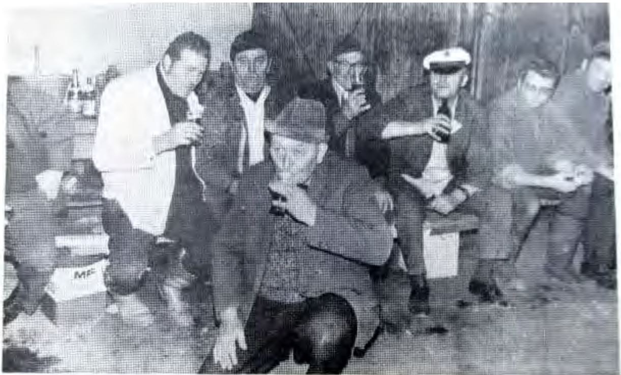
Nachbarn und Freunde des Hauses Schäfer-Engel trafen sich Silvester zum Nachbarschaftstreffen in der Schmiede.