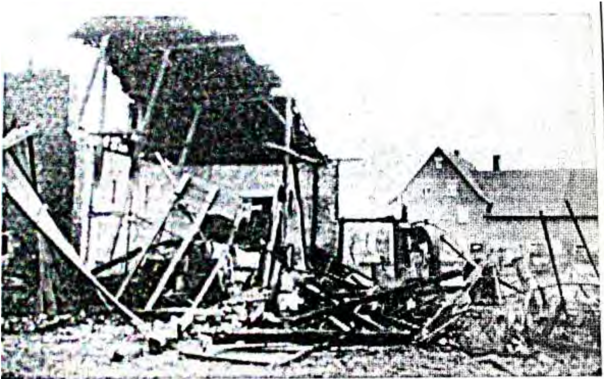
Die Ruinen der Lagerhalle in Höringhausen

300000 Mark Schaden bei Großbrand in Höringhausen Lagerhalle des Hofgutes ging in Flammen auf — Ursache noch nicht geklärt