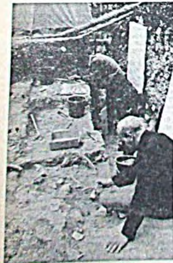
Mit Mauerkelle, Spachtel und Pinsel wurden die steinzeitlichen Funde bei Buhlen freigelegt.