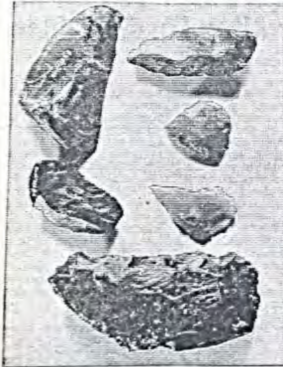
Zu den Steinzeitfunden bei Buhlen gehören auch Klingen, Messer und Faustkeile aus Feuerstein, der in dieser Gegend nicht heimisch ist. Vermutlich wurde schon vor 40 000 Jahren ein reger Tauschhandel betrieben.