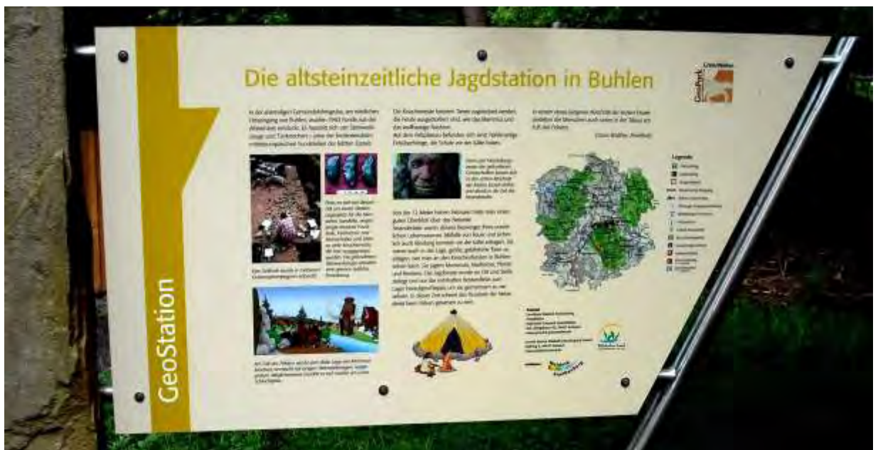
_ 1974 Abschnitt 12 Bildervortrag Abgeschrieben im Stadtarchiv Korbach, Heinrich Figge