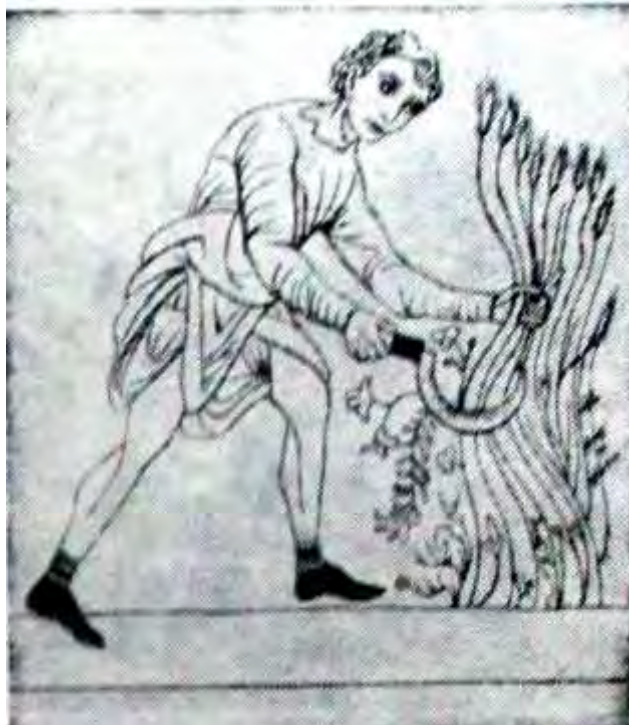
Bauer bei der Ernte (Mittelalterliche Zeichnung)

Die Schreiber, eine äußerst rührige Kaufmannsfamilie in Adorf, hatten neben dem Zoll und Wegegeld auch die „Wulfenwage“ gedinget“, daß er „die Wullen zum Eysen-“ berge umsonst weigen undt es mit den Unterthanen wie es von Altern her gebräuchlich gewesen, halten solle und davon Jahreszins entrichten (solle) 3 Marck gleich 1 Gulden 24 Albus“, das war im Jahre " 1585. Die Kaufmannsfamilie der Schreiber in Adorf hatte damit für ihren Bereich das Privileg erworben, die anfallende Schafwolle aufkaufen zu dürfen. Das „Wollenwägen" gehörte, wie „Pfungstbicr, Freischießen, Kirchweihen, Schnadezüge, Eierlesen, Erntehahnen, Hausheben" zu den Gegebenheiten, die mit ihrem „Fressen, Saufen, Spielen, Toben und Tanzen" nach Ansicht der Landesregierung überhand genommen hatten und zu unterbinden waren. Dieses „Wollenwägen" wurde im Anschluß an das „Schafewaschen" durchgeführt, dem dann tunlichst die Schafschur folgte.