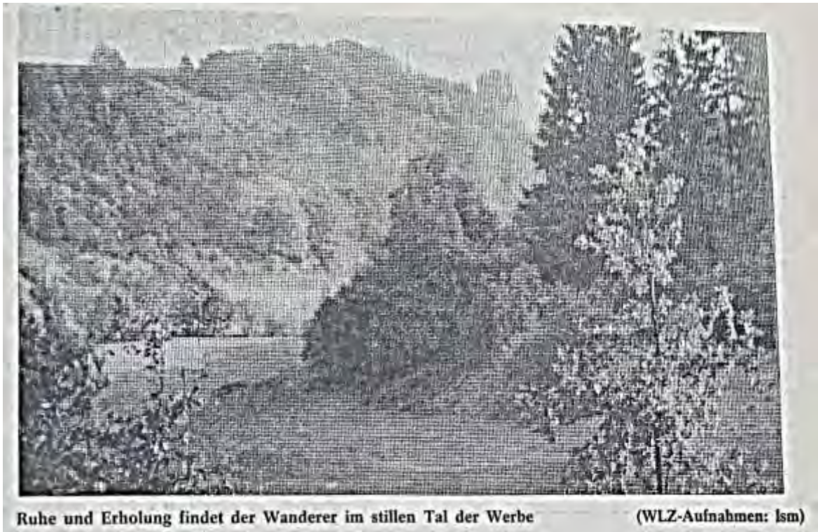
Ruhe und Erholung findet der Wanderer im stillen Tal der Werbe