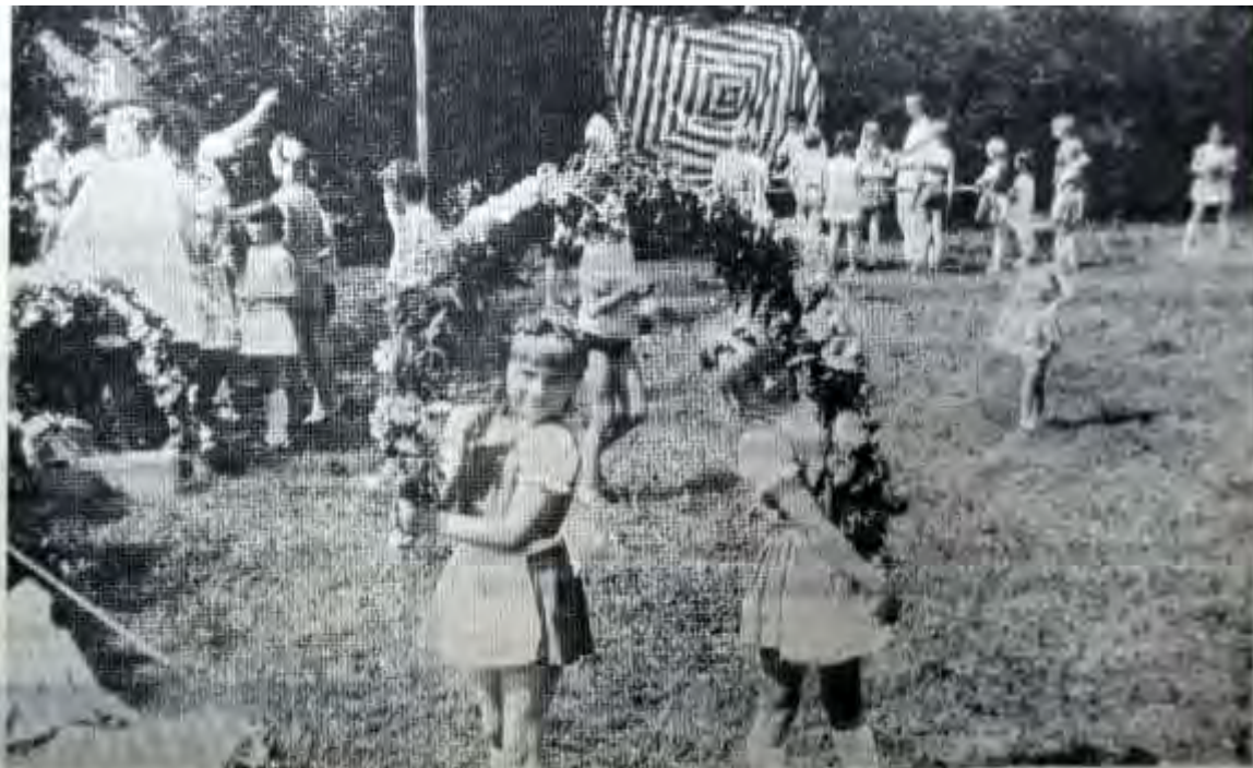
Auch sie tragen zum Gelingen der 100. Kirmesfeier in Höringhausen; Voller Stolz führen die Kinder ihre Blumenkränze vor.

Auch sie tragen zum Gelingen der 100. Kirmesfeier in Höringhausen; Voller Stolz führen Kinder ihre Blumenkränze vor.