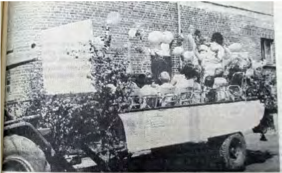
Beim Festzug wurde auch der Wunsch nach einem Kindergarten laut.

Beim Festzug wurde auch der Wunsch nach einem Kindergarten laut. Hier bemühen sich die Höringhäuser Kleinen um die Preise beim Sackhüpfen