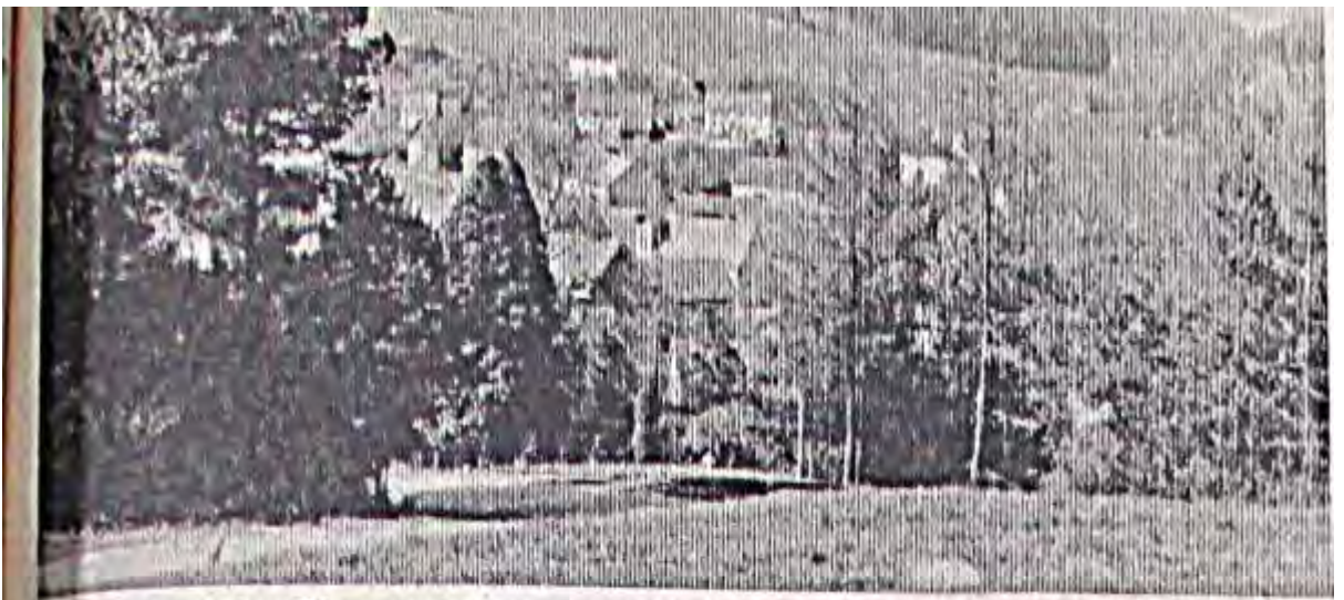
Eingebettet zwischen Wiesen und Wäldern liegt Alraft (vom Ortberg her gesehen)