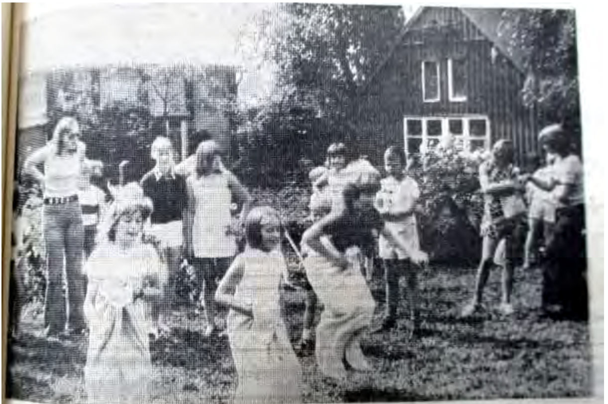
Eifrig bemühen sich die Höringhäuser Kleinen um die Preise beim Sackhüpfen.

Beim Festzug wurde auch der Wunsch nach einem Kindergarten laut. Hier bemühen sich die Höringhäuser Kleinen um die Preise beim Sackhüpfen