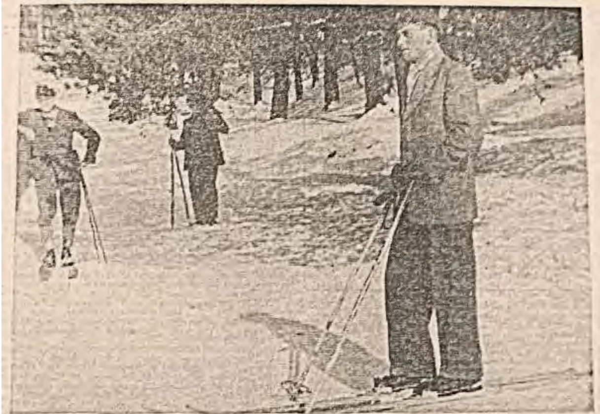
Bald ist es wieder soweit, eine Skiwanderung durch den tiefverschneiten Schiebenscheid bringt Freude und Erholung.