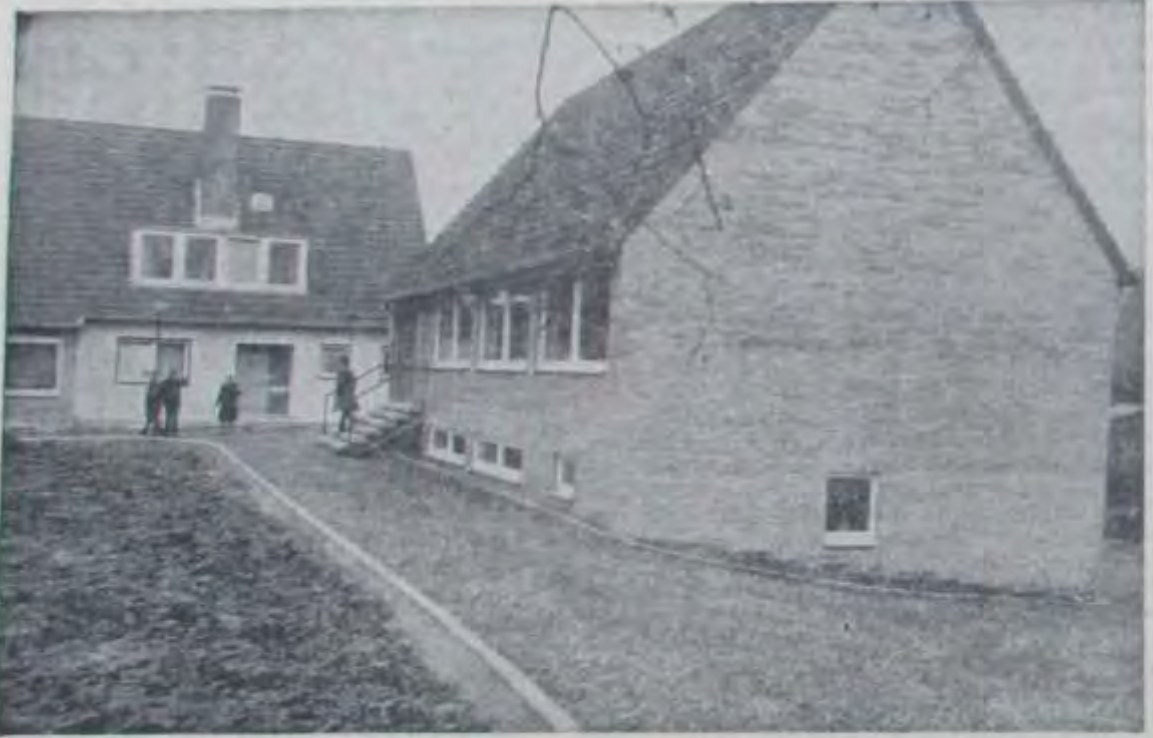
Links — querstehend — das Pfarrhaus, rechts das neue Gemeindehaus. In Verbindung mit der Kirche wird damit das Gemeindezentrum in Höringhausen vervollständigt.