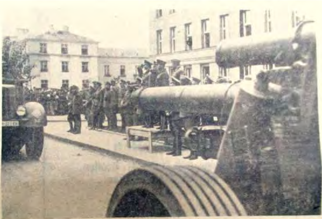
Parade deutscher und sowjetrussischer Truppenteile in Brest-Litowsk

Vor dem Kommandierenden General eines deutschen Armeekorps und dem russischen Brigadegeneral Krimoschen als Vertreter der Roten Armee fand anlässlich der Besetzung der Demarkationslinie eine Parade deutscher und sowjetrussischer Truppen vor dem ehemaligen Wojwodschaftsgebäude statt.