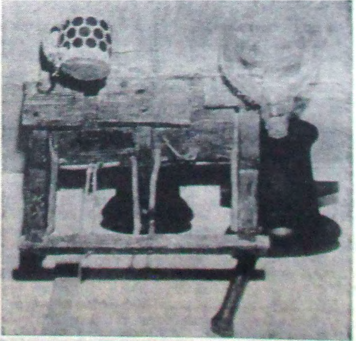
Das Gestell in der Mitte ist eine Mausefalle, die so konstruiert ist, daß die Maus von dem herabfallenden Holzprügel erschlagen wird. Die Flasche mit dem „Loch“ im Boden diente zum Fliegenfangen.