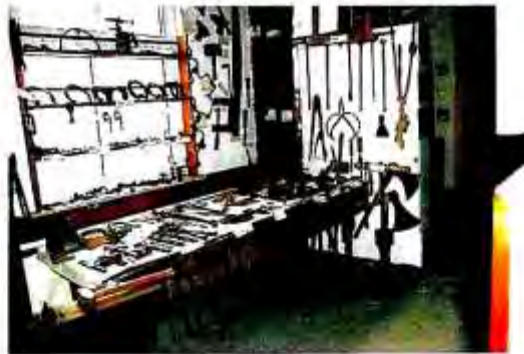
Schmiede und Stellmacherei