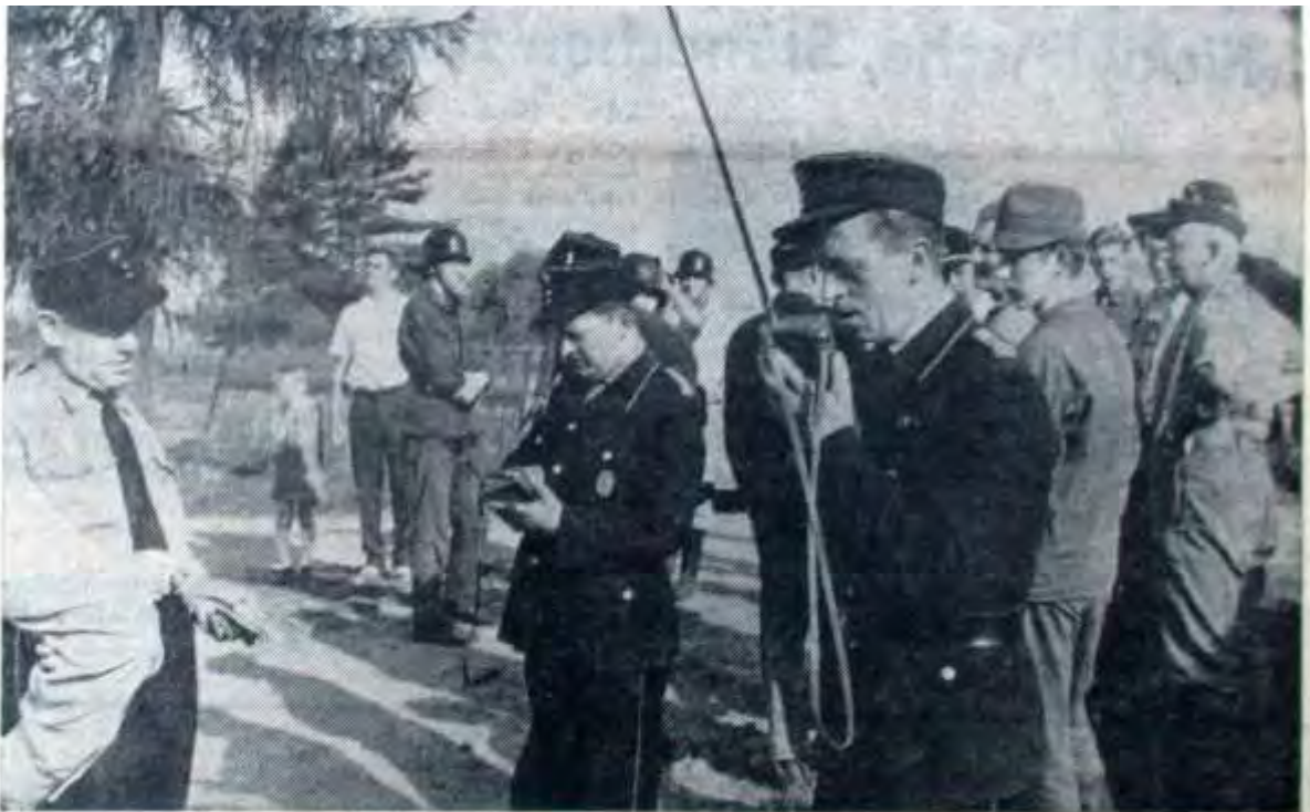
Ohne Funksprechgeräte ist ein Großeinsatz der Feuerwehren kaum noch denkbar.