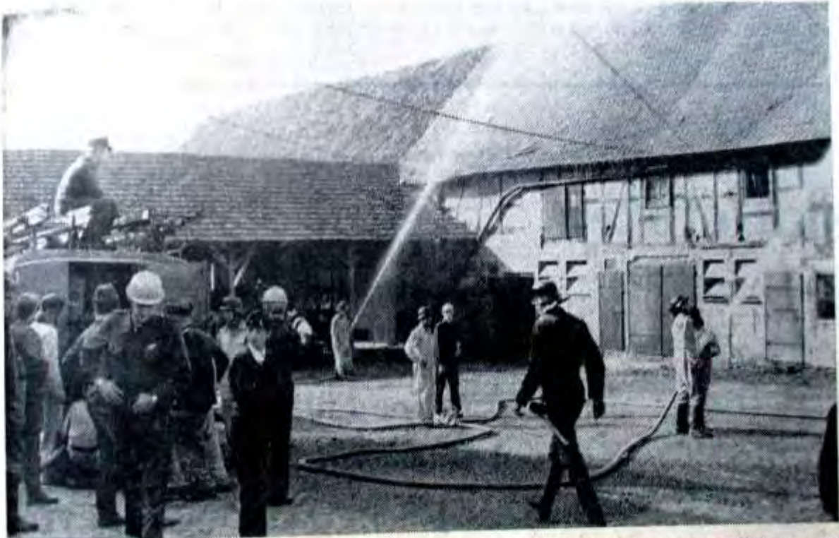
Die Löschwasserbeschaffung auf Hof Heide war sehr schwierig, aber dann spritzte es aus allen Rohren.