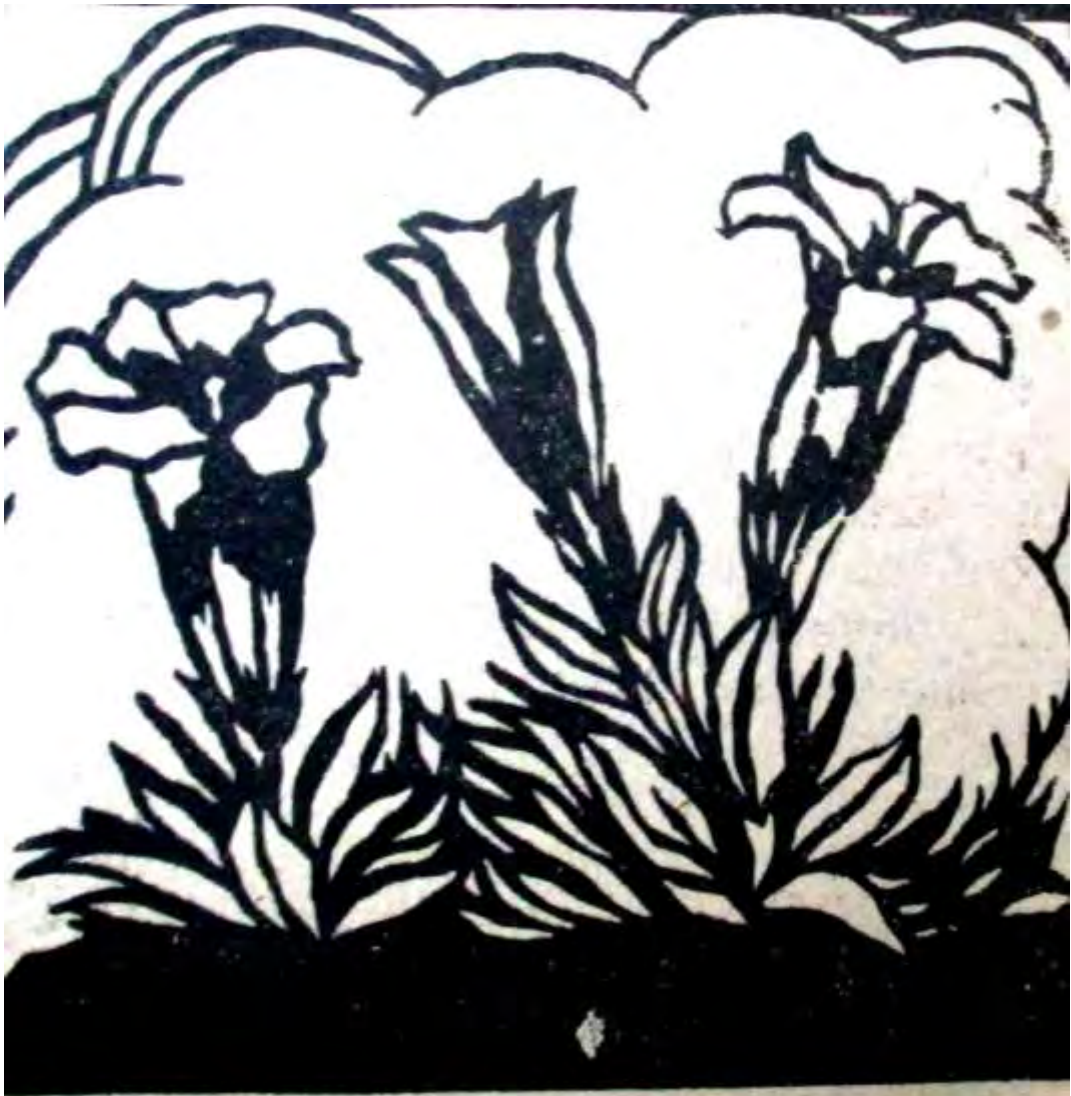
Der Enzian blüht