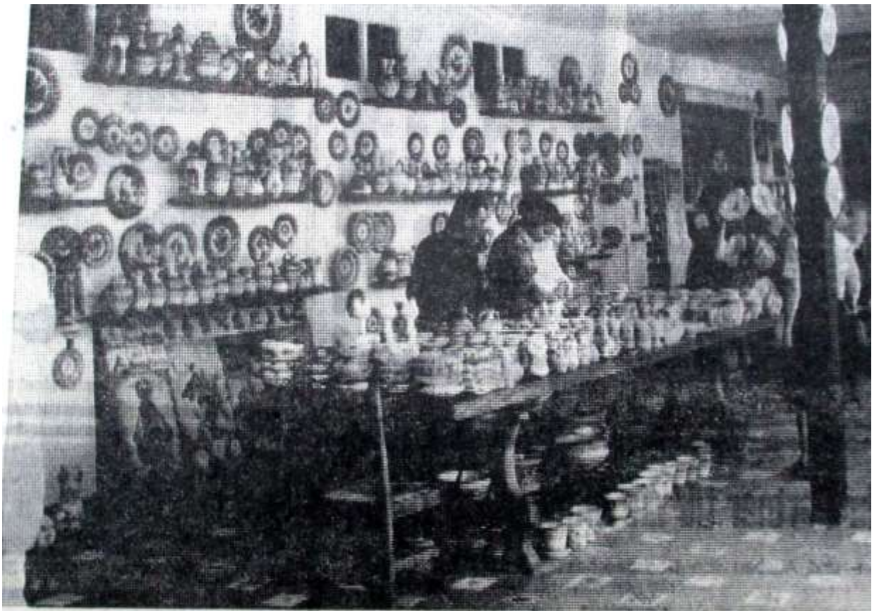
In dieser Tontöpferei in Al Cantara machten die Hauswirtschaftsmeisterinnen Station.