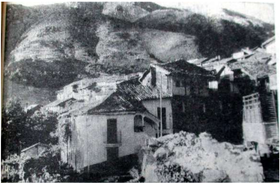
Della Vera Cruz, ein Dorf in den Bergen bei Caceris.