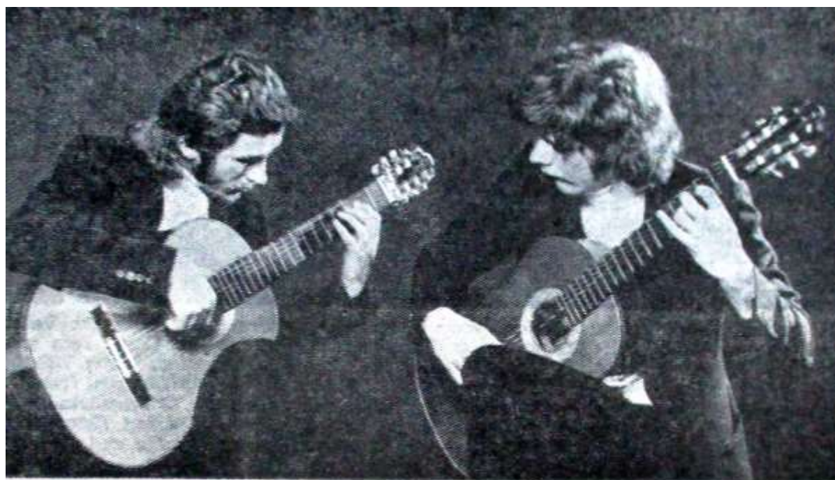
Begeisterndes Gitarren-Konzert in der Kirche von Höringhausen