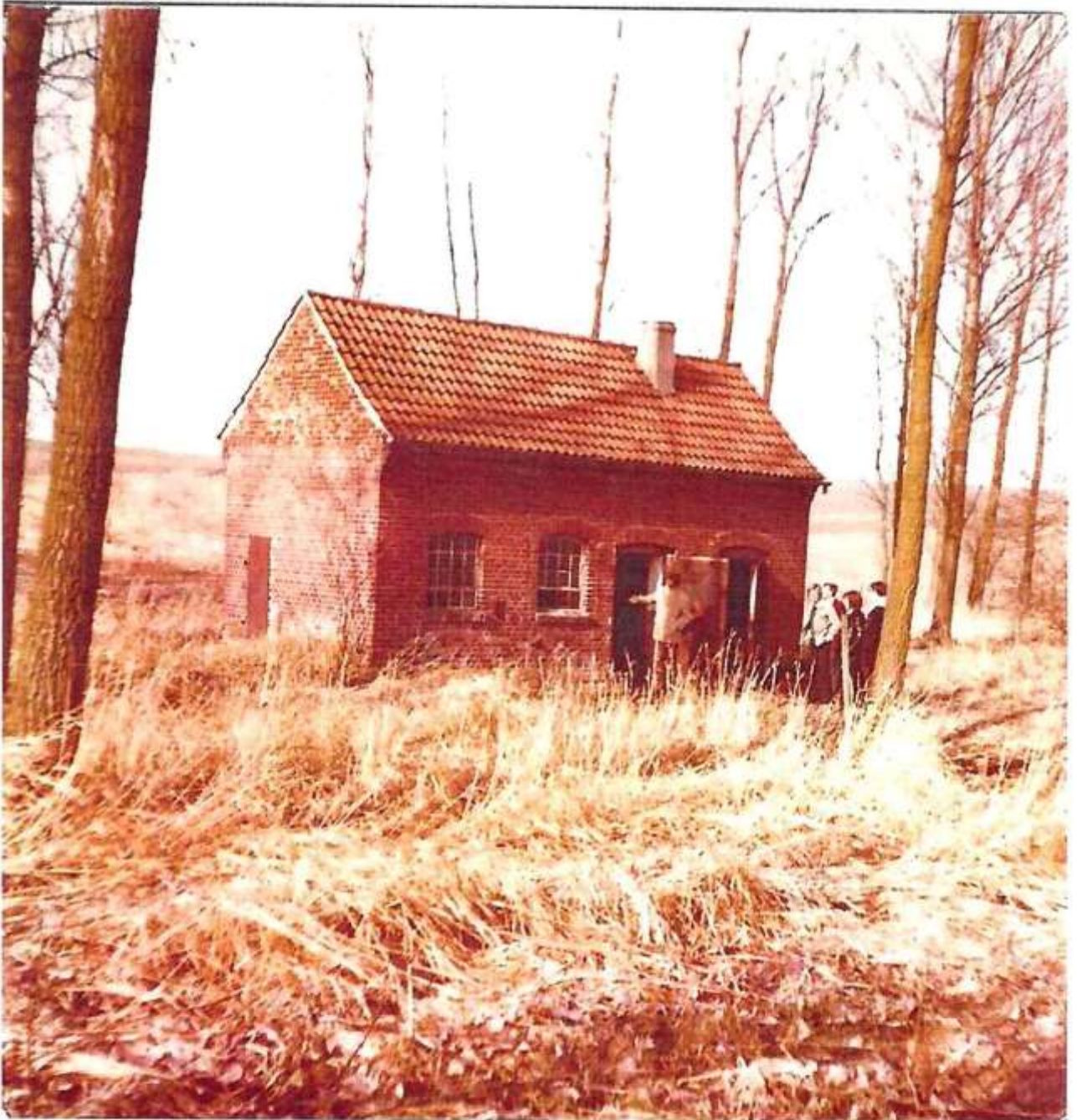
Die Übernahme 1975