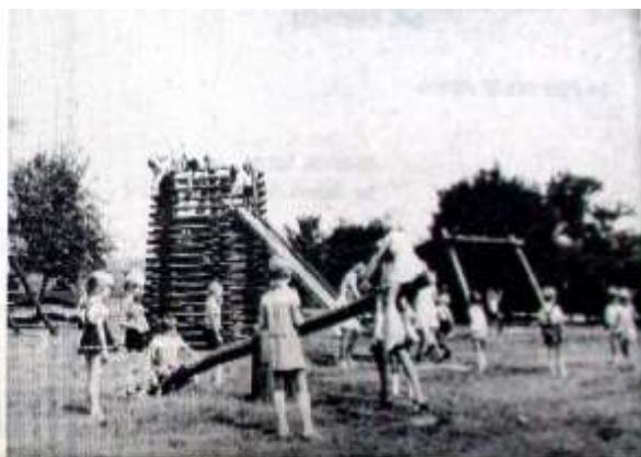
Sowohl Spielzeug und Einrichtung in den Räumen als auch die vielfältigen Geräte im Freien verfehlten ihre Wirkung nicht auf die ersten Besucher des neuen Kindergartens im Waldecker Ortsteil Netze, der am Samstag seiner Bestimmung übergeben wurde.