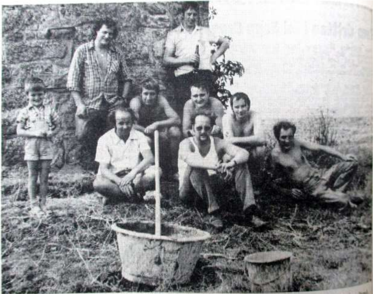
Die Männer des Clubs 66 bei einer wohlverdienten Ruhepause.