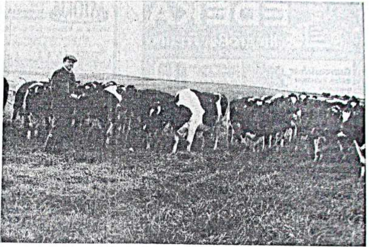
Einen Ausschnitt aus der Leistungsherde. Im Vordergrund (Mitte) eine Derby-Tochter mit der Spitzenleistung von 9000 Kilogramm Milch Jahresleistung. Rechts im Bild der Betriebsleiter H. Ulrich Miedke, der auf dem Gebiet der praktischen Landwirtschaft als „Allroundman“ gilt und in verschiedenen Berufsorganisationen für die heimische Landwirtschaft tätig ist.