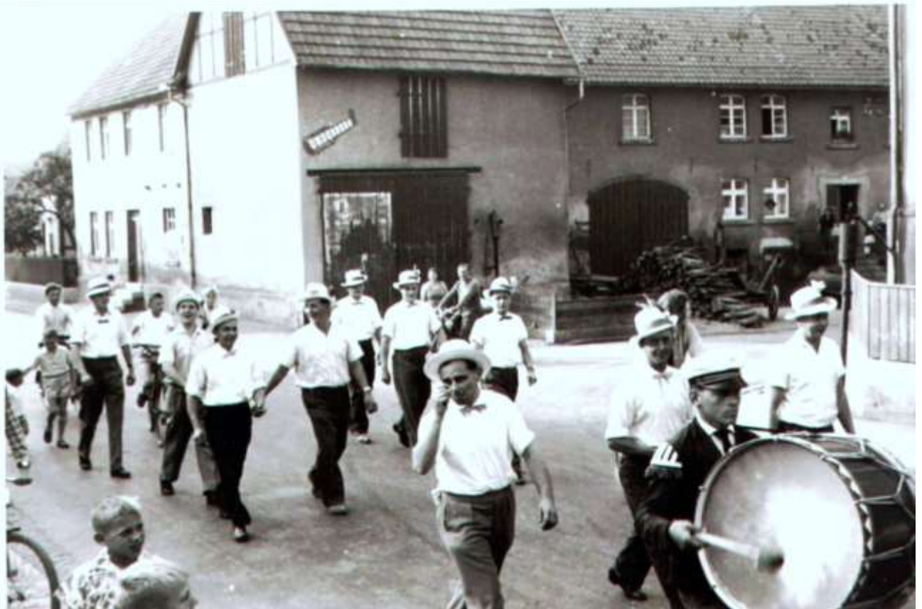
Kirmesbursche war ich öfter mal. Hier Bilder aus dem Jahr 1959