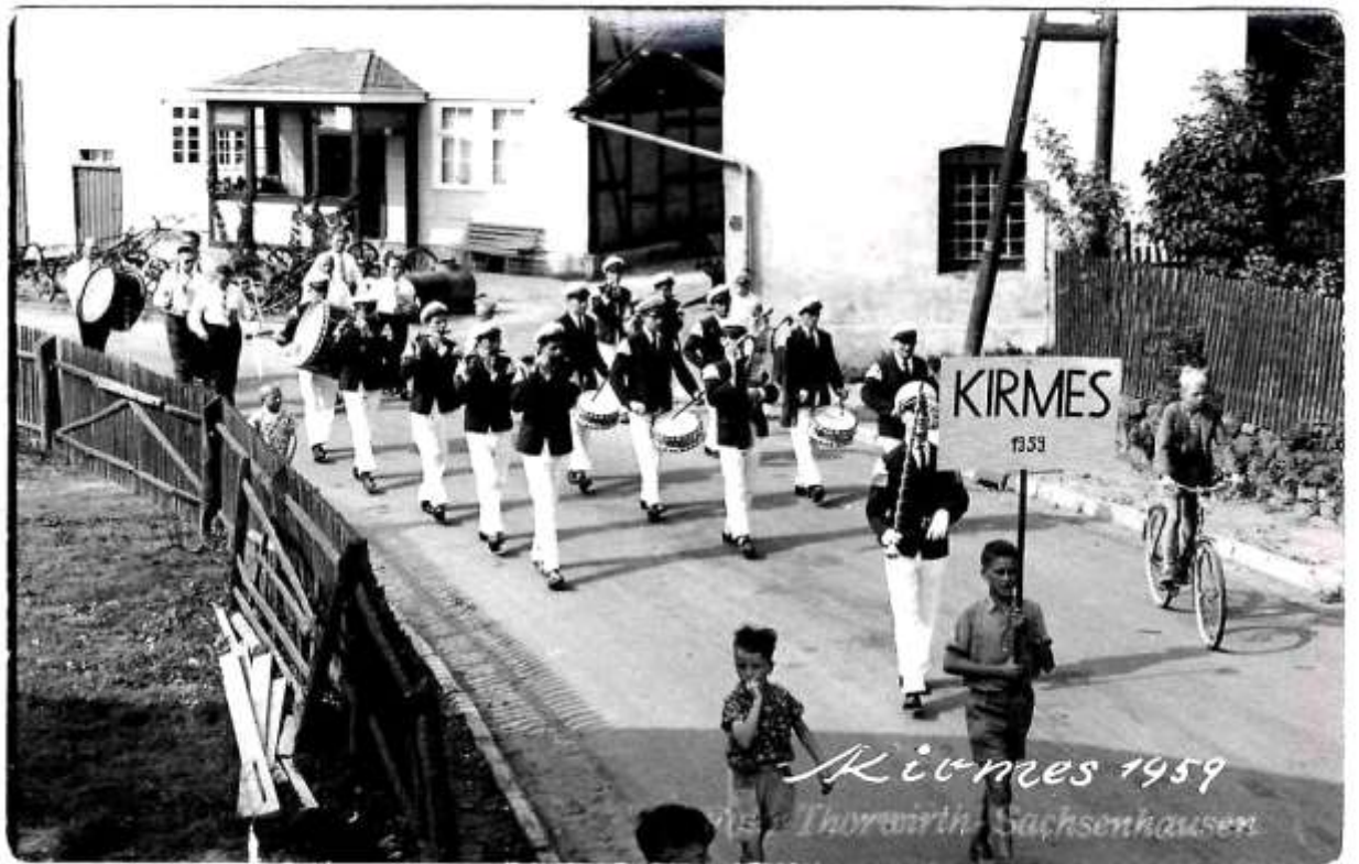
Kirmes 1959 Thorwirth Sachsenhausen