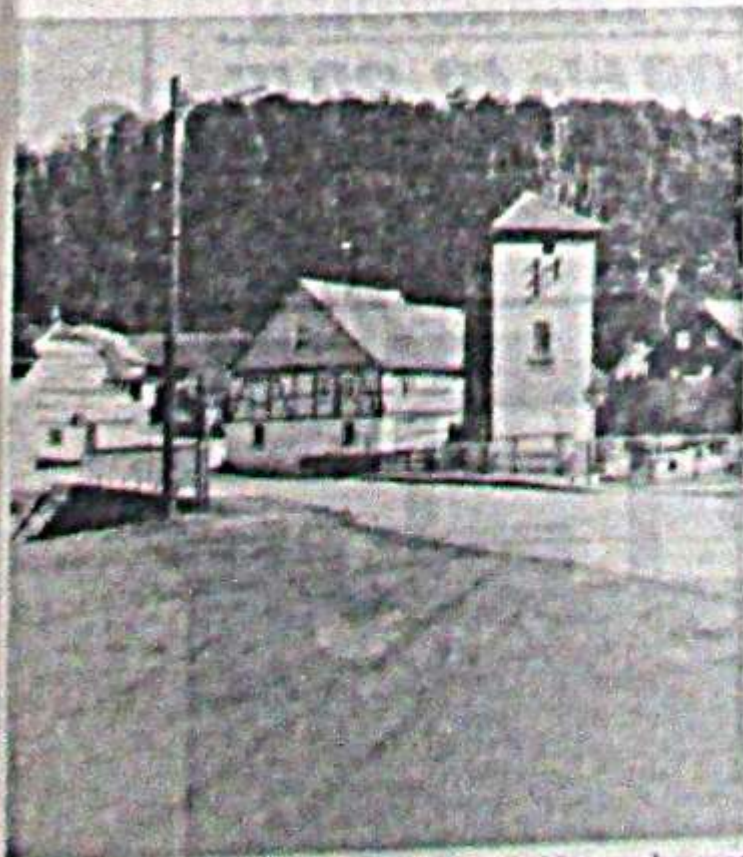
Diese Brücke verband noch 1970 Oberwerba und Ober-Werbe. Am 1. Januar 1971 schlossen sich beide Gemeinden zusammen.