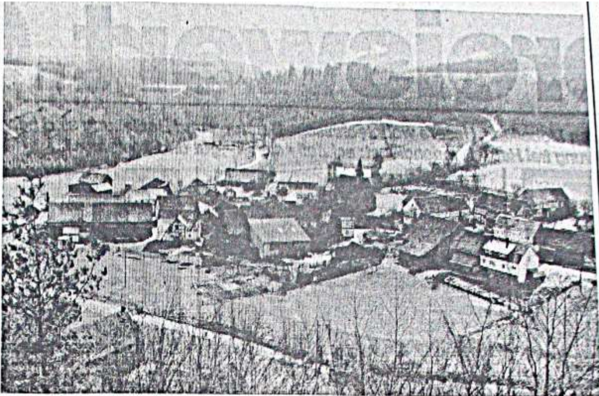
Vom „Langen Stein“ fällt der Blick weit ins Land, über Ober-Werbe und das Werbetal hinweg.