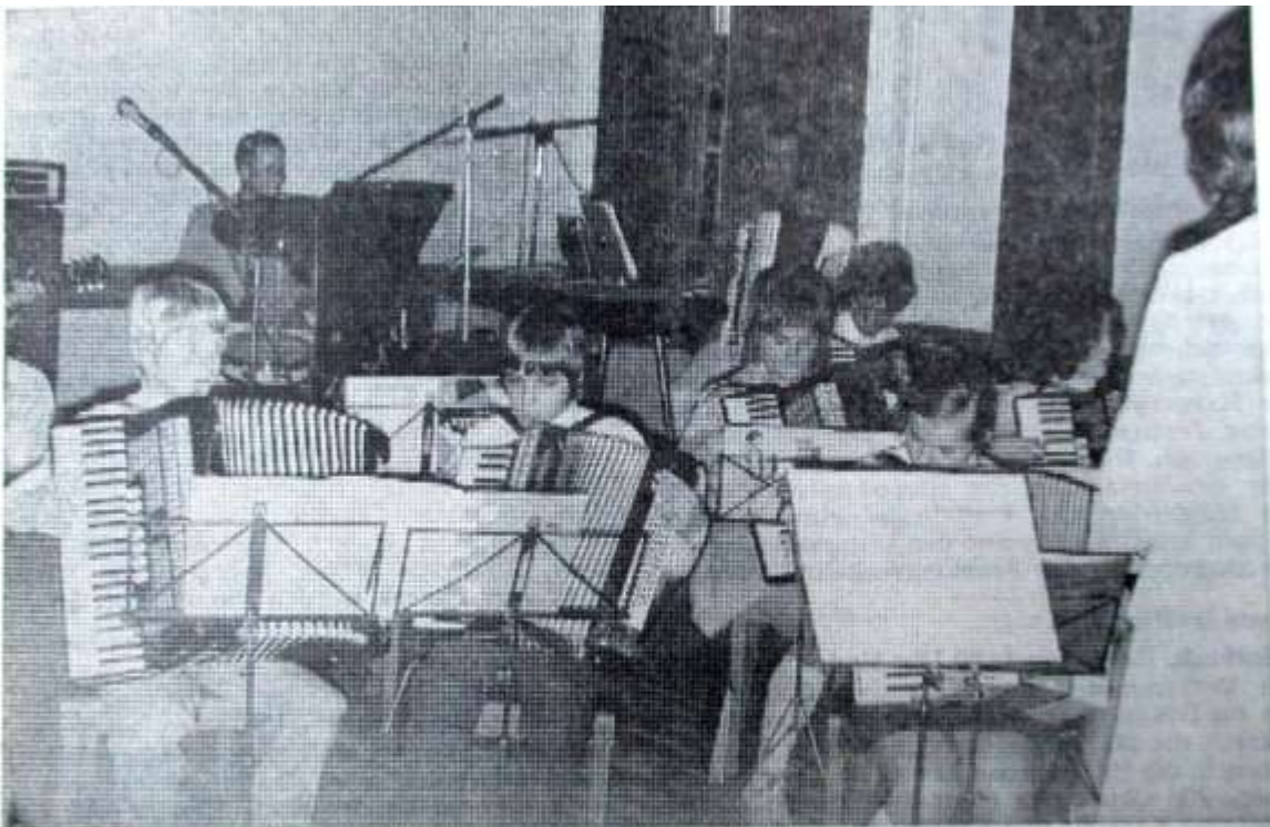
Die aus Höringhäuser Jugendlichen bestehende Akkordeongruppe erspielte sich wohlverdienten Beifall.