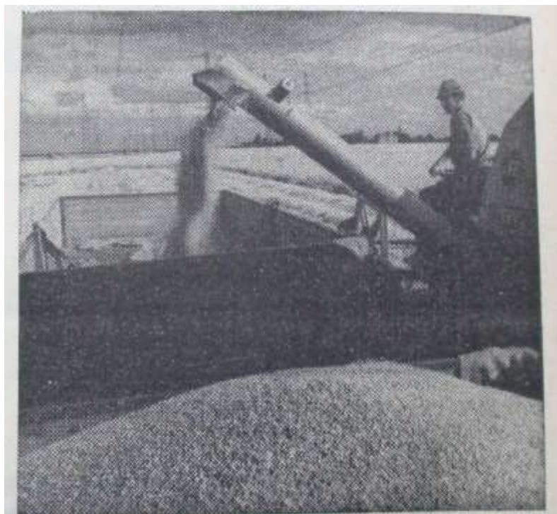
Weite Getreideflächen; wo es früher von Ge- spannen und Menschen wimmelte, birgt heute ein einzelner mit seinem Mähdrescher das Korn.