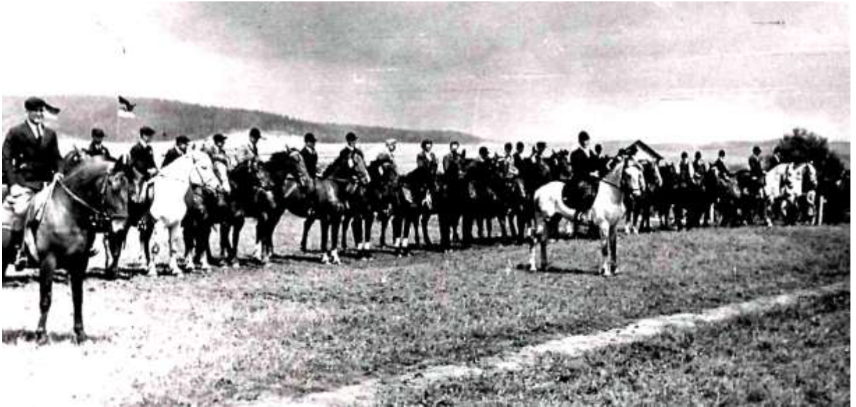
Reiterverein Sachsenhausen, hier ritten die Höringhäuser Reiter mit - unten