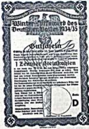
Steinkohlebesitzgutschein bestimmt, Originalgröße 108x146 mm. Schwarzer u. roter Druck auf weissem Grund.

Winterhilfswerk des Deutschen Volkes 1934/35