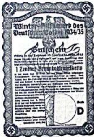
Braunkohlebesitzgutschein bestimmt, Originalgröße 108x146 mm. Blauer und roter Druck auf weißem Grund.

Genaus wie bei den Lebensmittelgutscheinen je nicht auch bei den Kohलगutscheinen jede währungsrechtliche Kennzeichnung Zahlungswert und ist.