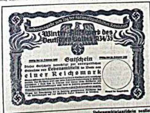
Lebensmittelgutschein bestimmt, Originalgröße 108x146 mm