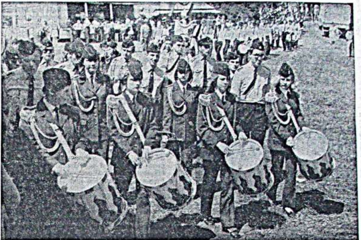
In einem Sternmarsch besuchten die Spielmannszüge die einzelnen Ortsteile Höringhausens.