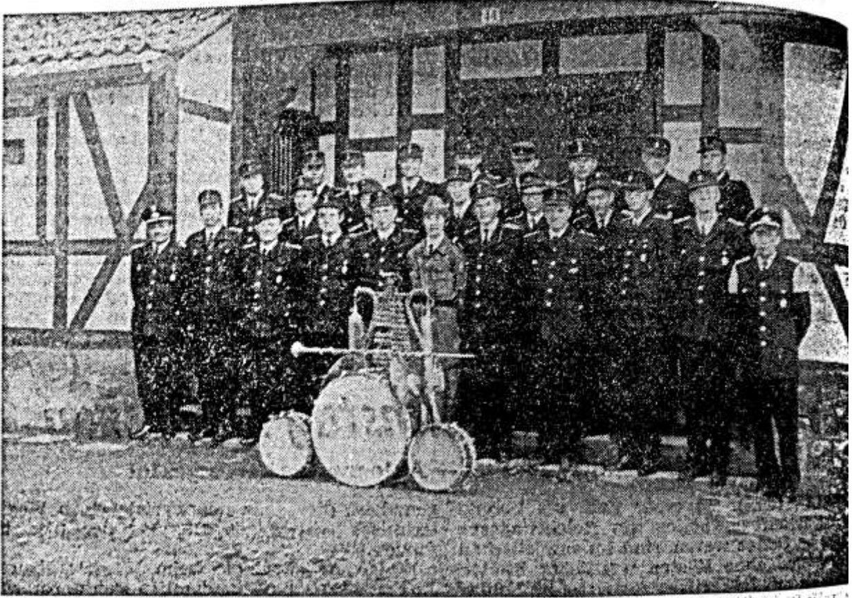
Die Mitglieder des Jubilars, mustergültig aufgereiht.