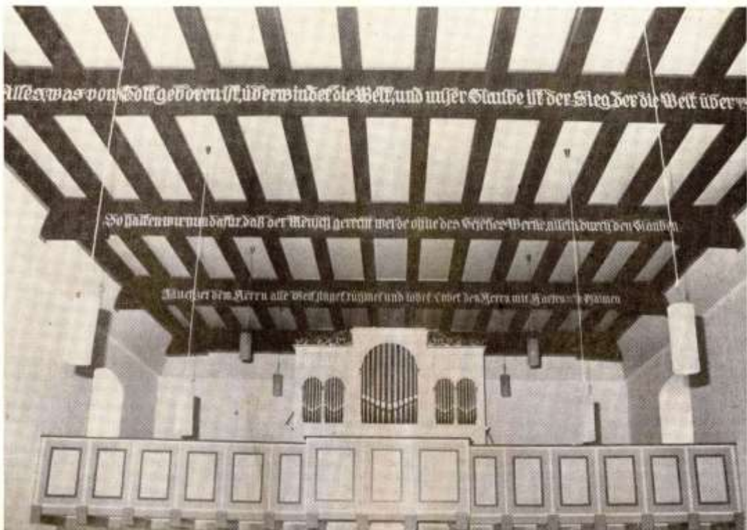
Helle, freundliche Farben bestimmen jetzt das Bild in der Höringhäuser Kirche. Hier ein Blick auf die Orgel und das Deckengebälk.