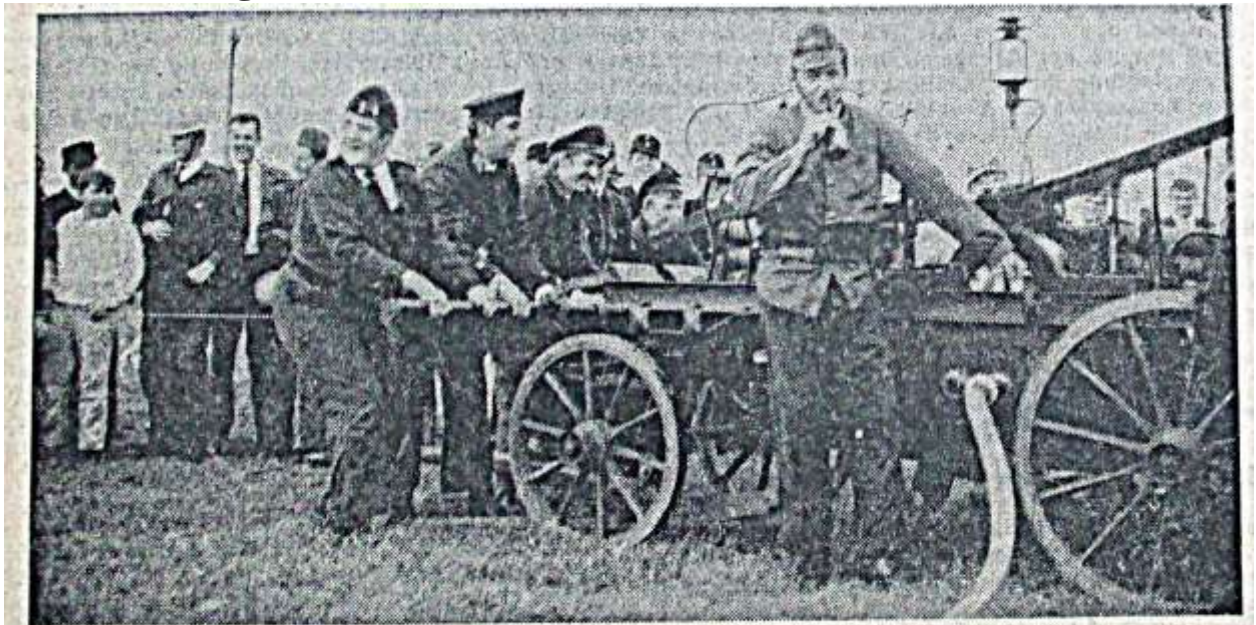
Bei der Schauübung „Einst und jetzt“. Vor 80 Jahren war diese Spritze ein „modernes Löschgerät.“