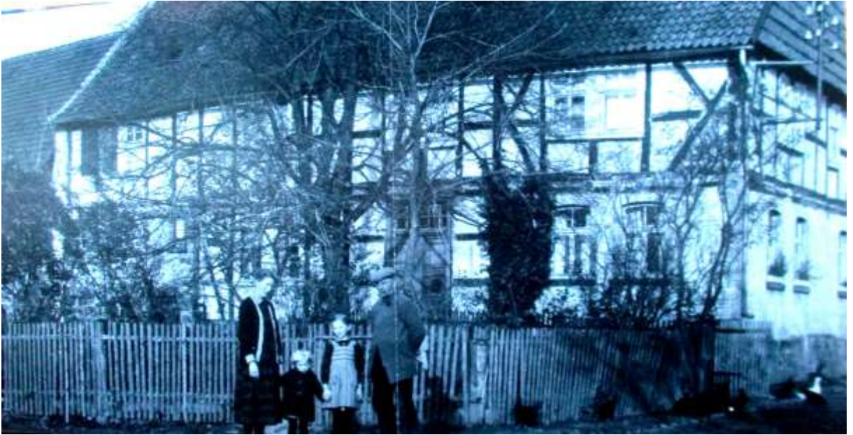
Früher war dies der „Darmstädter Hof“