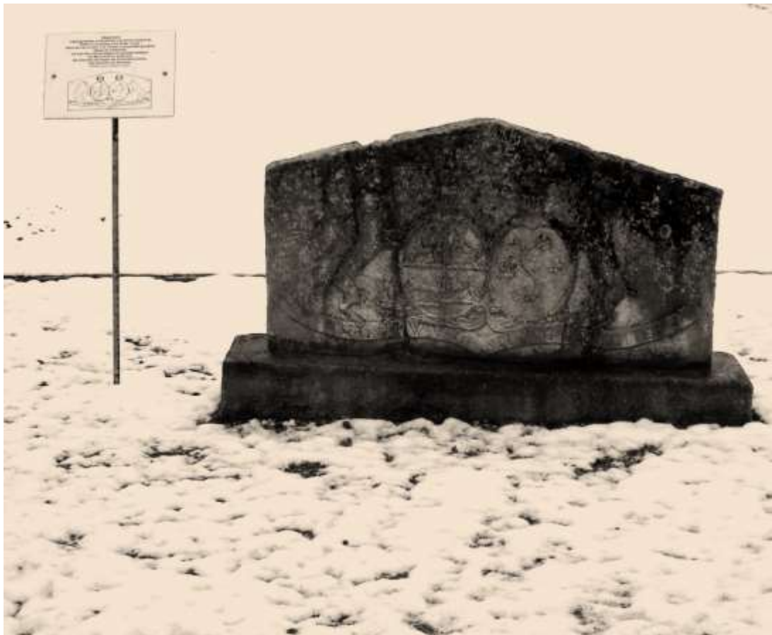
Der Wappenstein auf dem Dorfplatz, Aufnahme vom 09. 03. 2023

Er steht gegenüber dem Hoftor des ehemaligen Guthofes der Wölffe von Gudenberg, auf dem er sich über 200 Jahre befand.