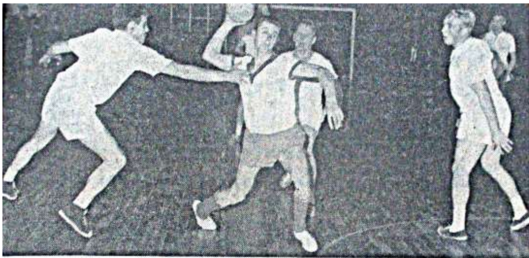
Höringhausen — Mühlhausen 12:7