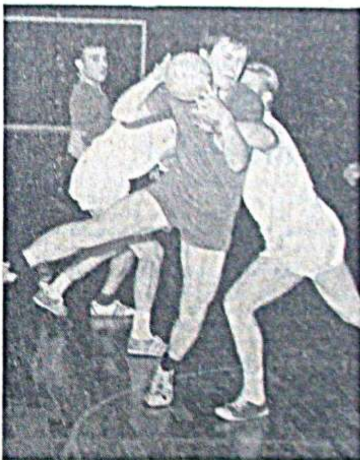
Twiste — Mühlhausen 12:8

der beiden anderen Spiele gegen Höringhausen und Korbach 09 kampflos ab.